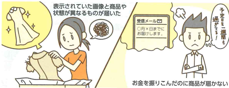
◆ 図 12 ネットショッピングでの詐欺の例

インターネット上で、安全に売買するためには、ショッピングサイトの信頼性を示すマークなどを調べて、信頼のできる業者かどうかを見分けることが重要である。マークのない業者や個人との売買で、トラブルを回避するためには、信頼できる第三者が取引を仲介する エスクローサービス を利用するとよい。